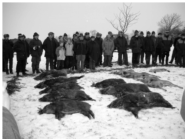
Abb. 1: Strecke nach erfolgreicher Bewegungsjagd