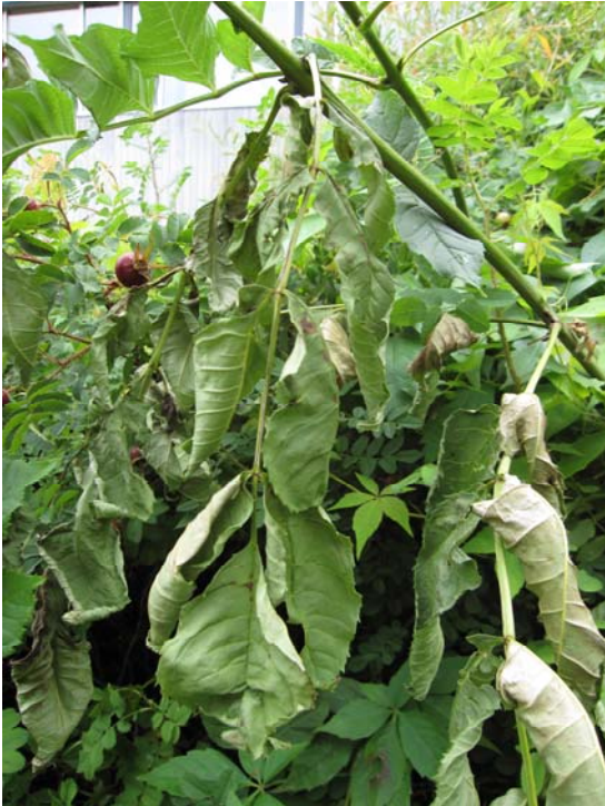
Abb. 2: Welkendes Eschenlaub.