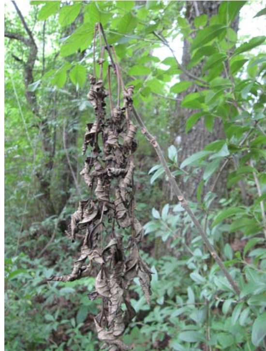
Abb. 3: Abgestorbene Blätter, die nicht aktiv abgeworfen werden können.