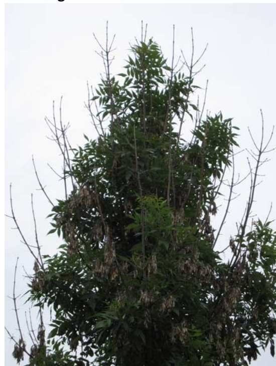
Abb. 5: Abgestorbene Triebe in der Lichtkrone einer ca. 10 jährigen Esche.