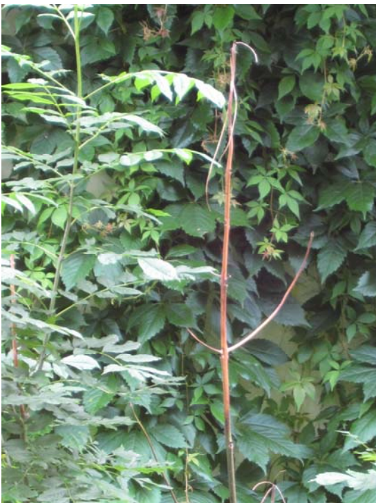
Abb. 4: Rindennekrosen und abgestorbener Trieb.